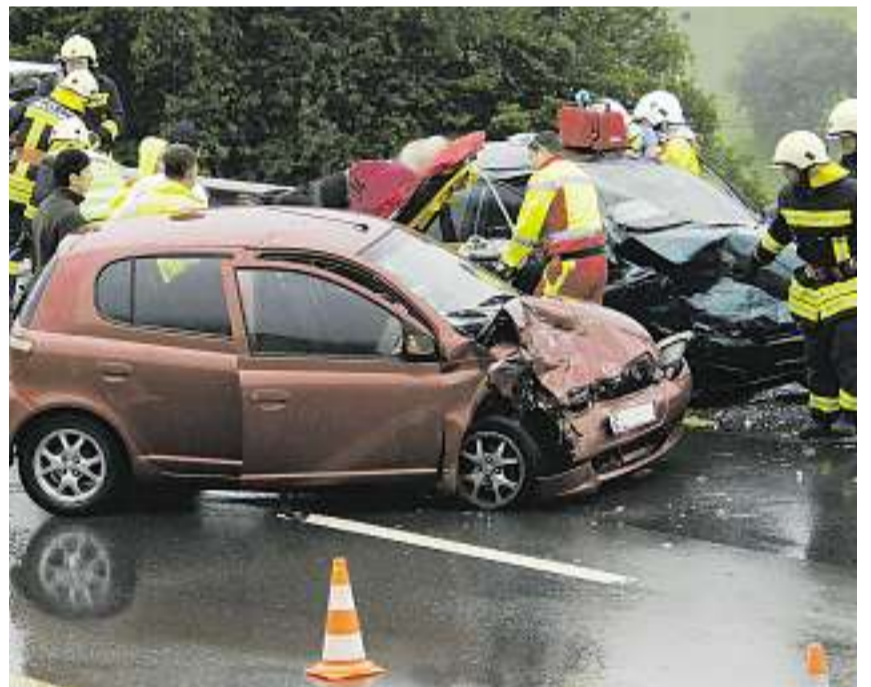
Strassenrettung durch die Feuerwehr Schwyz: Der Lenker des dunkelgrünen Fiat war in seinem Fahrzeug eingeklemmt.

Steinen. – Der Unfall ereignete sich vor 15.00 Uhr auf Steiner Boden, oberhalb des Gasthauses Adelboden. Ein 60-jähriger auswärtiger Lenker war von Schwyz Richtung Sattel unterwegs. Aus unklaren Gründen geriet er mit seinem Fiat plötzlich komplett auf die Gegenseite. Eine erste entgegenkommende Fahrerin riss das Steuer geistesgegenwärtig nach links und konnte ausweichen. Ein nachfolgender Toyota wurde vom Fiat erfasst. Die Frontalkollision forderte drei Verletzte. Der mittelschwer verletzte Aargauer Lenker musste durch die Feuerwehr geborgen werden. Ebenfalls mittelschwer verletzt wurden die Insassen im Toyota, ein älteres Paar aus der Umgebung. (g)